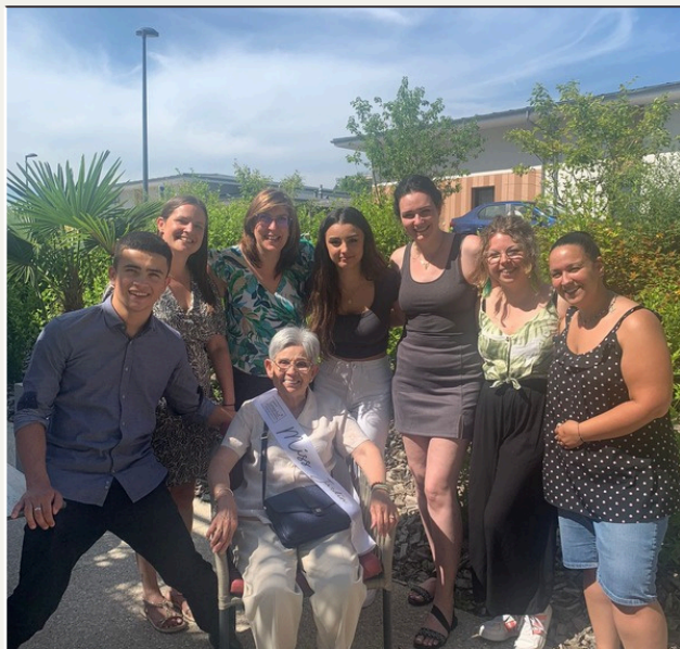
La Team SENIOR ACT